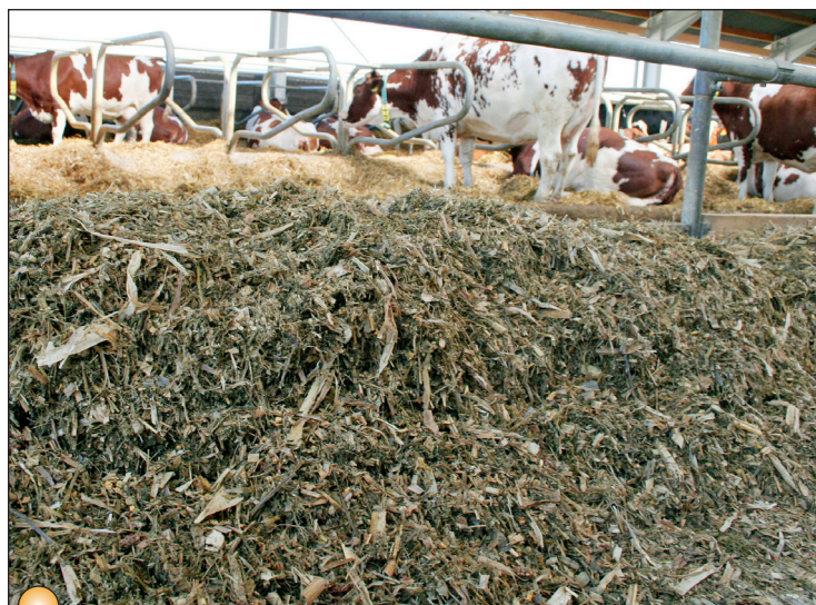
S verzí pro PDA má výživář složení krmné dávky v kapse i ve stáji

Program tvoří etikety přímo z receptury ve čtyřech jednoduchých krocích. Uložená etiketa je svázána